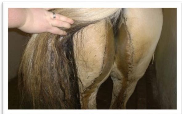
Billede 1. Dag 0 før behandling.

Flere og flere hesteejere oplever efterløb hos deres heste, især ved foderskift – fx når de starter på vinterfodring med wrap eller når de kommer på fold i foråret og får frisk forårsgræs. Efterløb viser sig ved at hesten har afføring/diarré ned af bagbenene, og mange gange med en sur stram lugt i boksen.